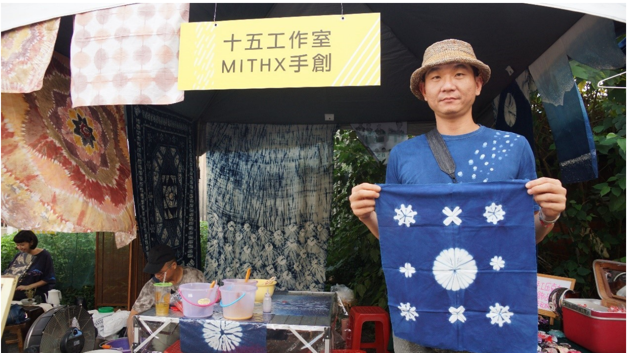
現場邀約鄰近縣市手作職人參與展示和體驗，讓攤位內容更加豐富。