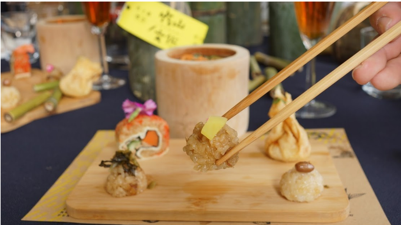
地方老米糕，前三顆為地方老店原味米糕，後方三顆為以傳統作為創意料理。