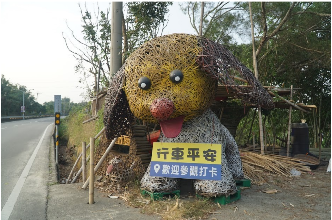
百竹園入口意象-米格魯竹編藝術

來到會址，迎接訪客是一隻高度約 230 公分高的竹編可愛的米格魯，若竹編藝術可以辨識出動物名稱與品種，這點出了這項作品製作比例傳神與手藝的細膩。