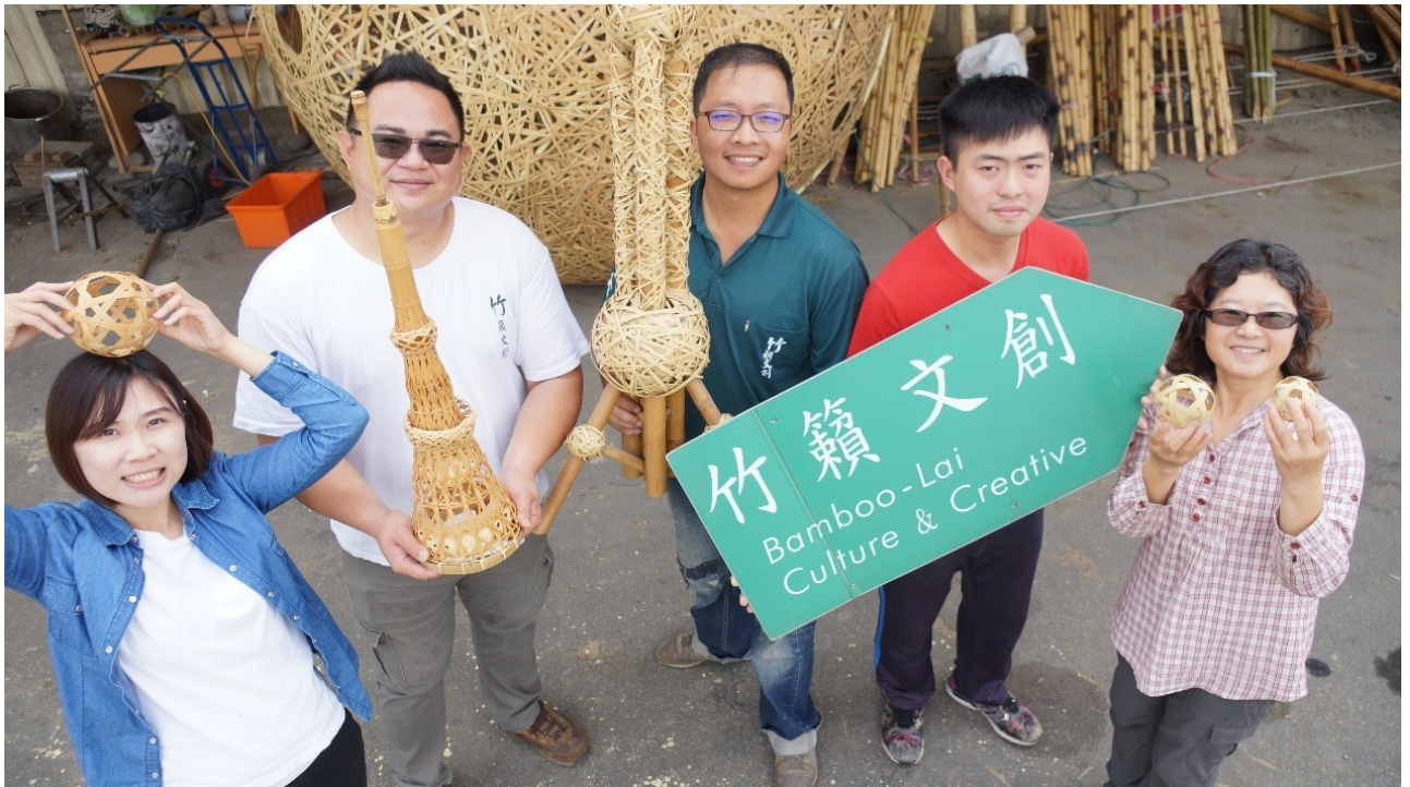
竹籟文創的工作團隊合影。

從竹籟文創的歷程可見到，以竹構造工藝為基礎在竹鄉立足，是可行的創業途徑，不一味地墨守舊思維，傳承技藝而不忽略市場需求和團隊合作，這新的服務型態，是以美學和展覽專業服務來整合實踐。竹跡館成功關鍵，為各式竹材特性應用、竹編技法使用、精準的作