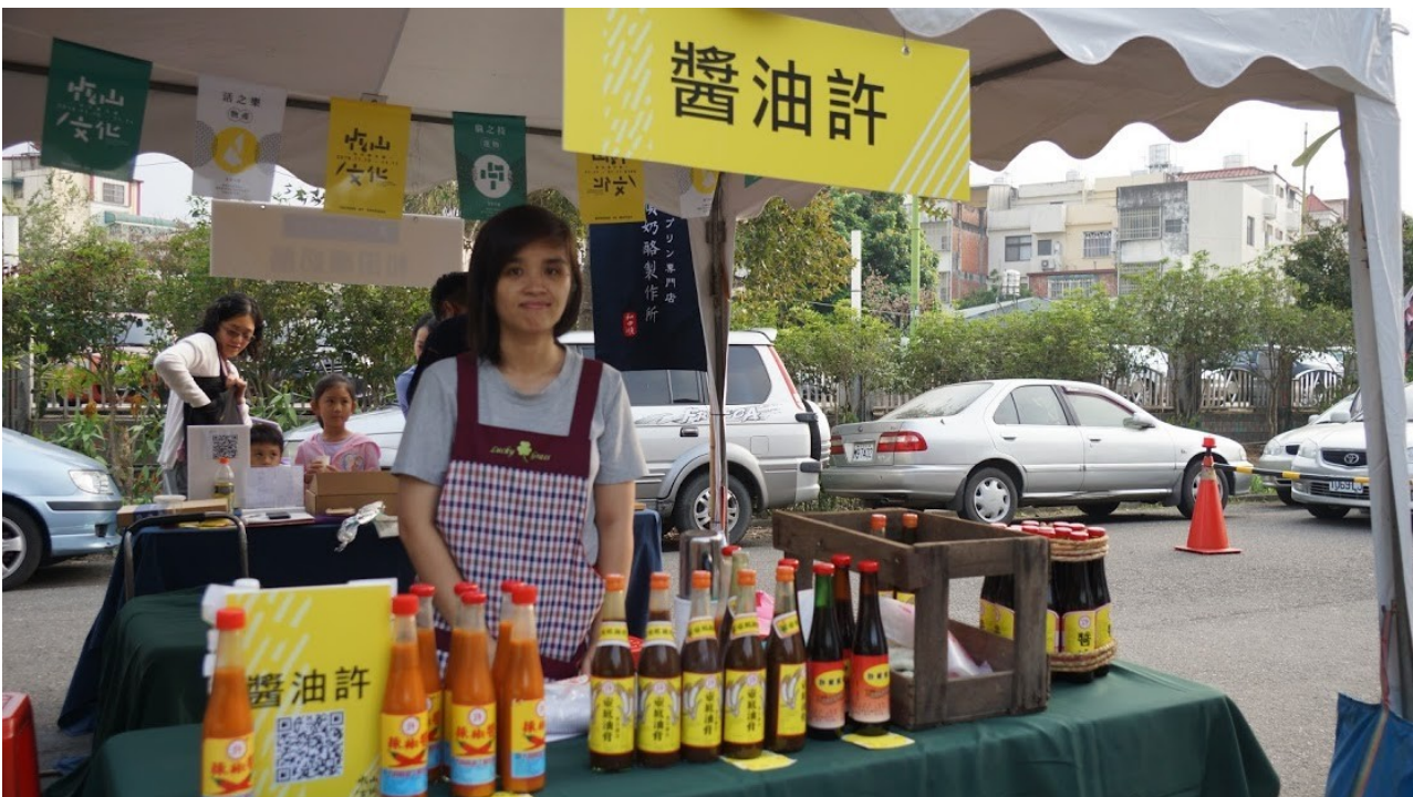
竹山傳統醬油製造坊-醬油許，除了在食之藝的料理中被使用，也在現場和民眾交流。