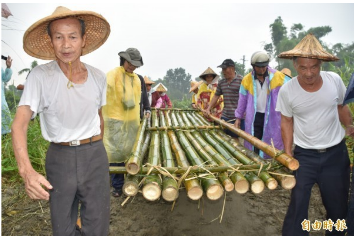
竹筏在溪畔綁好後，眾人同心協力抬到溪中放流。