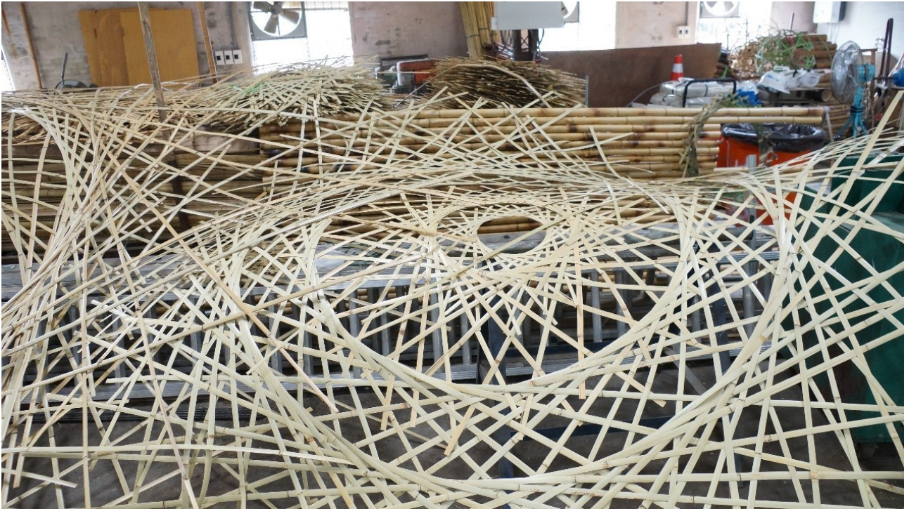
不同造型與結構需求都需要考量選用的編法。