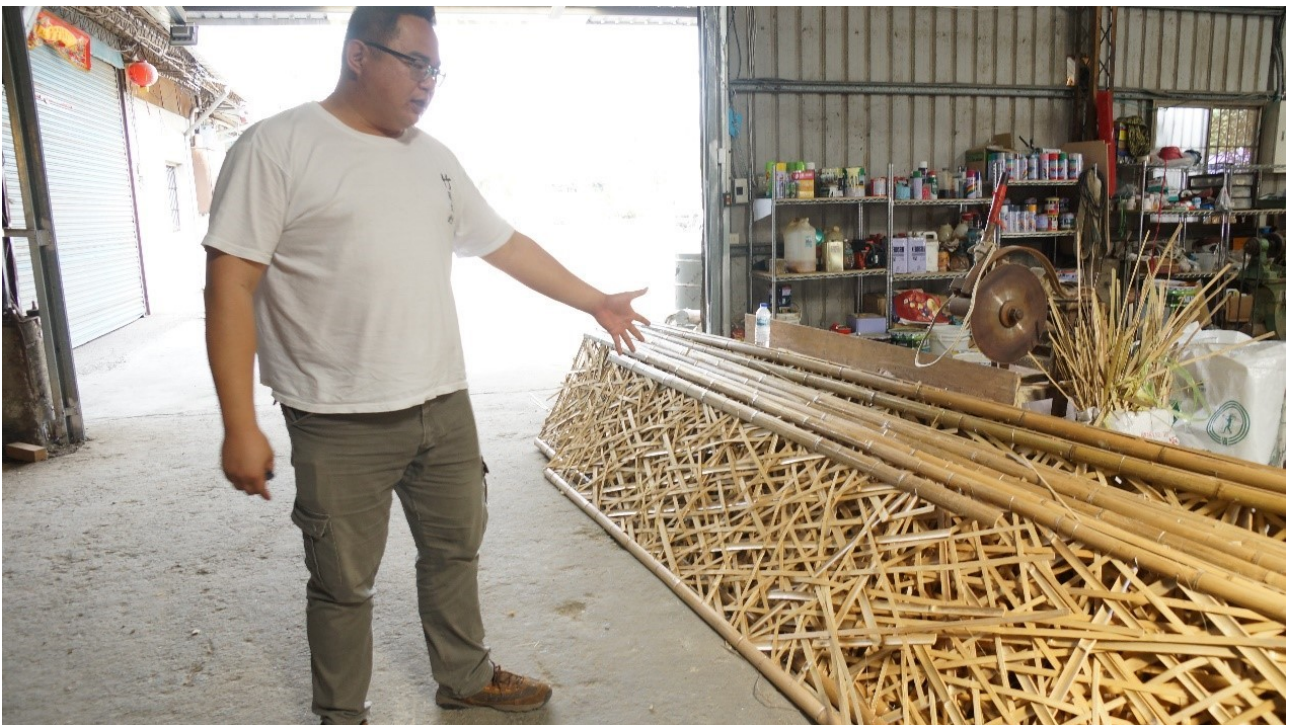
竹跡館的成功關鍵之一，模組化的單元物件。