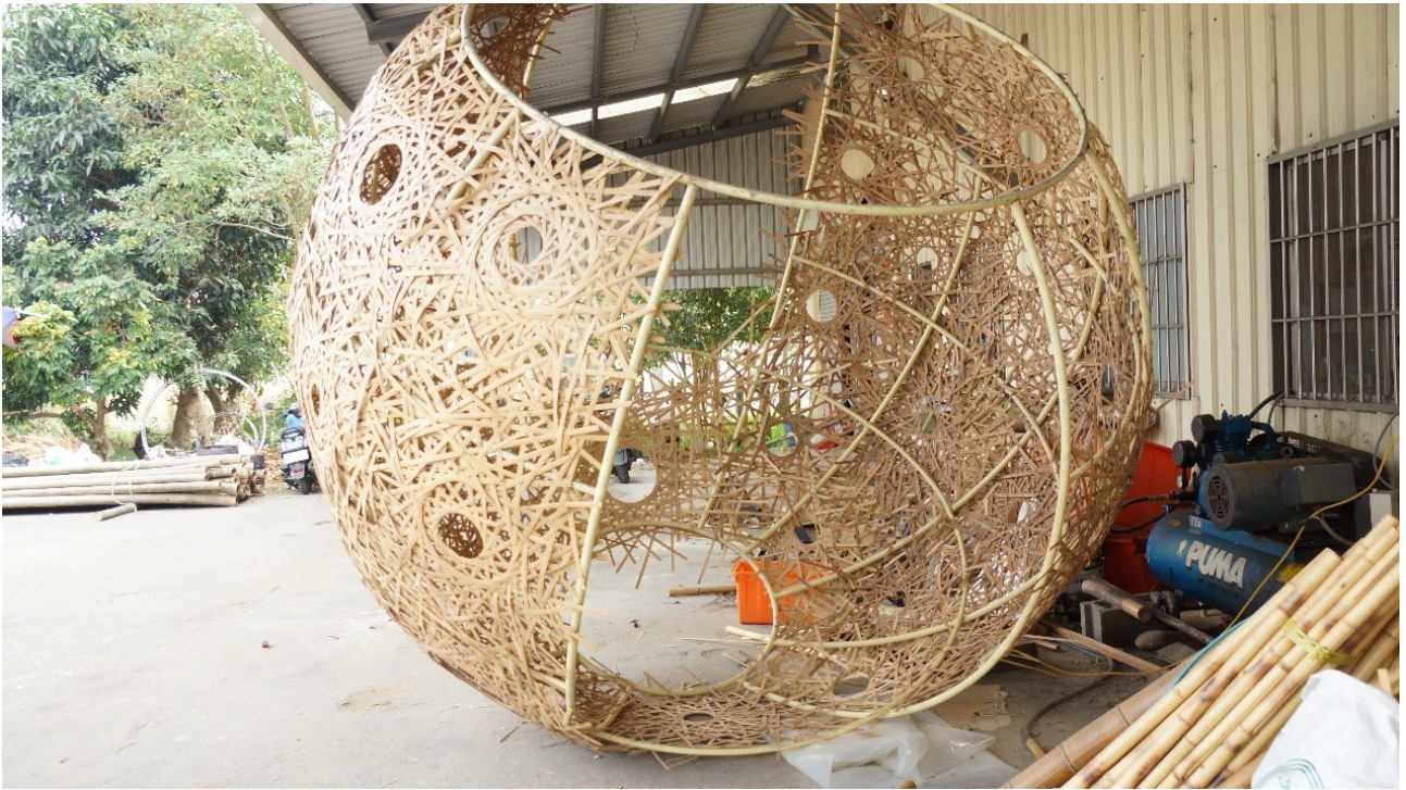
團隊正趕工 2019 集集鎮燈會作品。