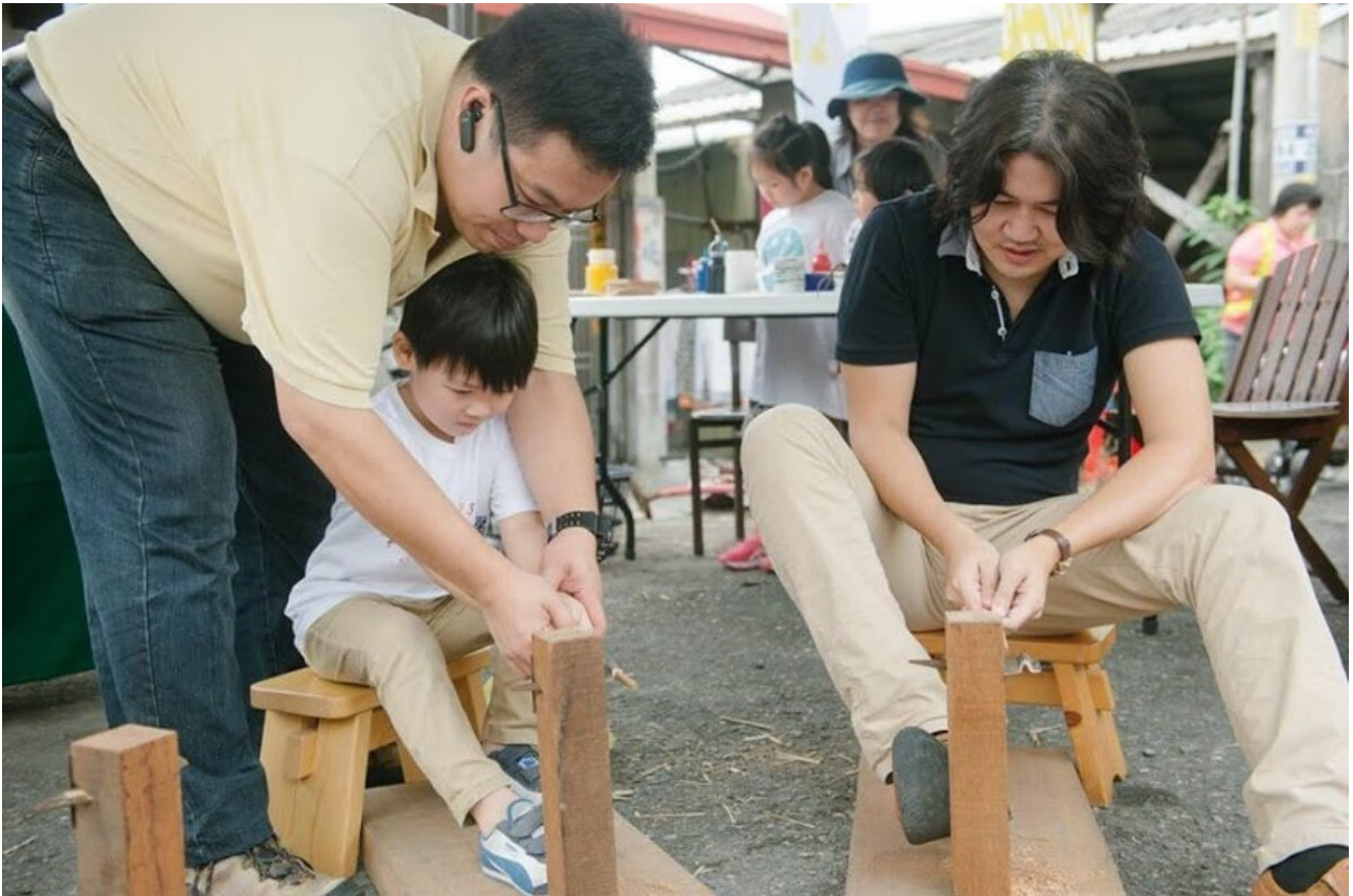
在地竹材生活用品製造廠-璞園藝術坊現場教學製作竹筷。