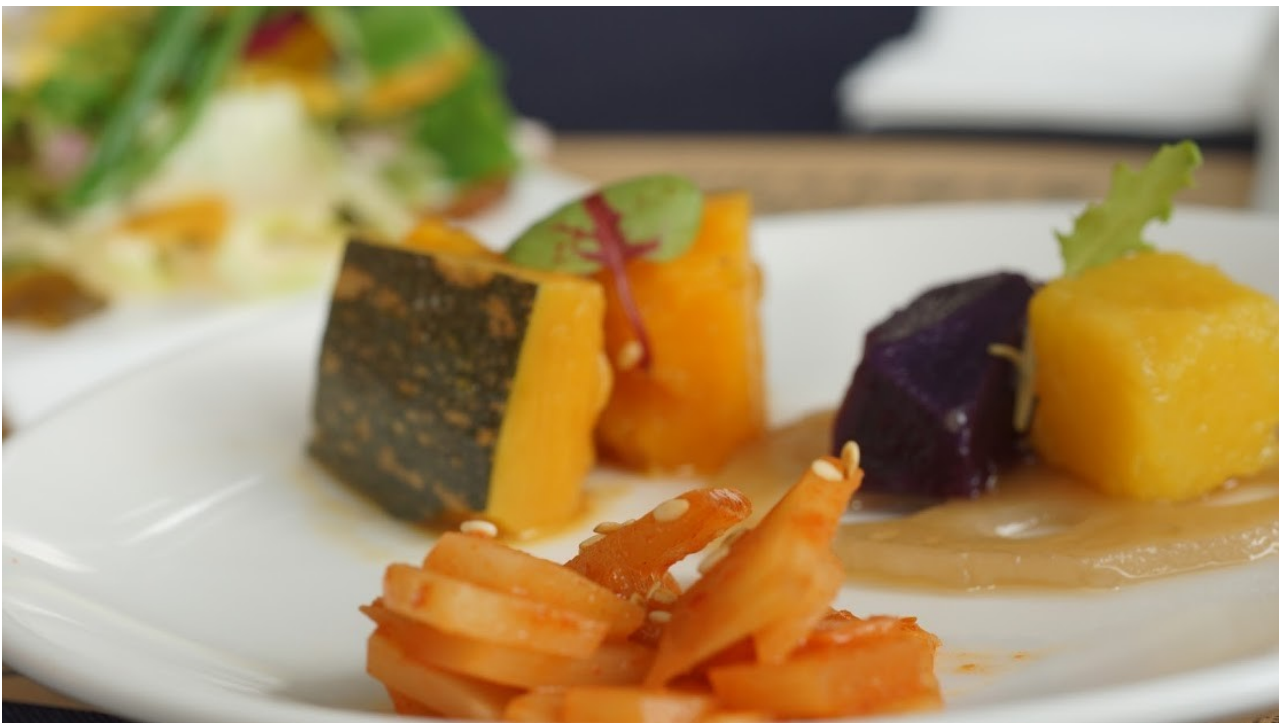
前菜-蜜薯、辣筍和漬南瓜。

此次活動主題之一【食之藝】。開場的前菜是由在地食材所組成的食蔬沙拉，而其中的令人感興趣的是佐食，蜜薯、辣筍和漬南瓜，前二者是餐桌上向來是左耳和右耳關係一樣，到老是不相見的，一為甜點一為佐菜，居然同時間出場，品嚐後著實令人驚艷，能喚起食客對於竹山記的憶。主食為竹筒容器，打開後映入眼簾的是熟悉的香菇、筍干以及控肉，控肉以西式燉法料理而成，非傳統的腿庫或是三層肉，味道和視覺皆有著衝擊傳統的新穎感受，而副食的巧妙不得不讓人佩服，一端上桌是六顆米糕，長得有些相似，原來是竹山有三家米糕店，各有擁護者，周正弘將三家的米糕集合於同一盤上，並個別以創作料理形式給予新生命，讓原本競爭的各家米糕可以在餐盤上大和解，也給了饕餮新的生命力。