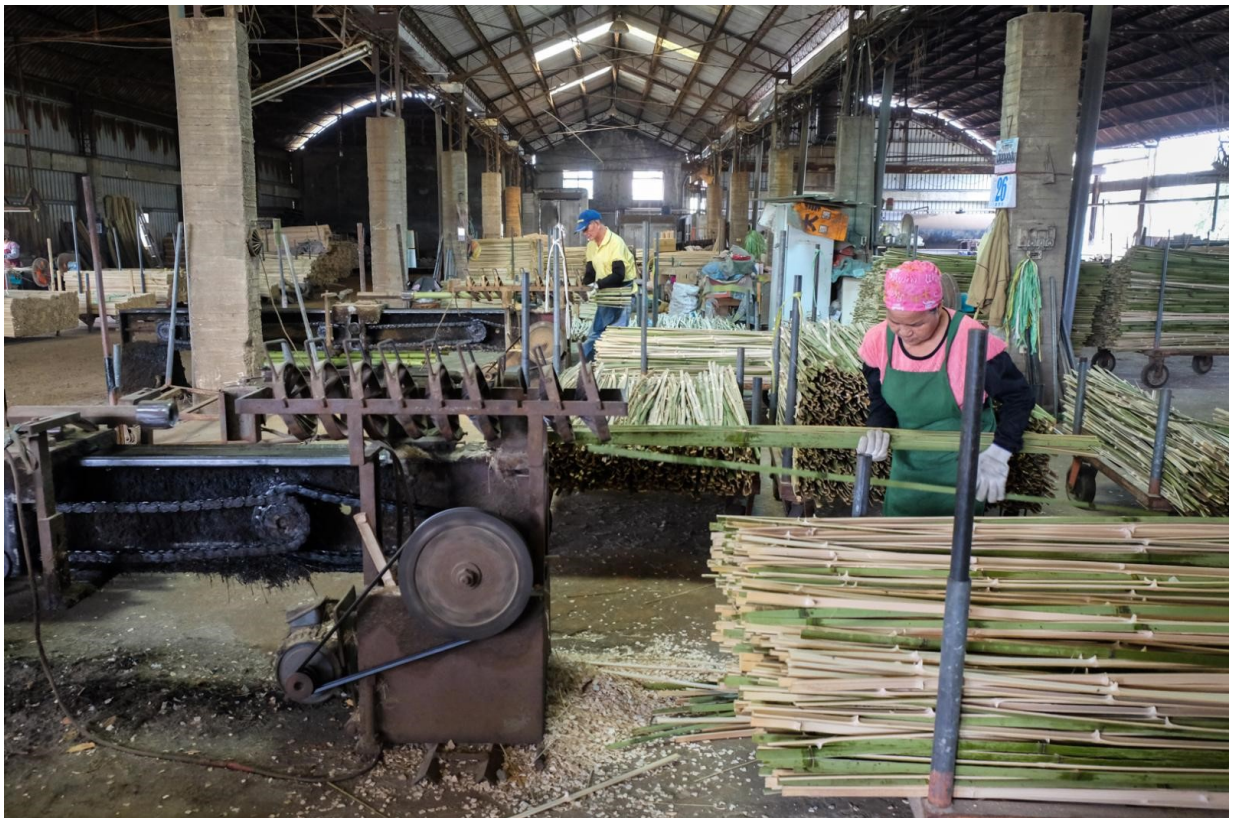
竹山鎮是臺灣竹產業重鎮，至今仍留有許多加工廠

這天是竹鹿產業觀光促進會的理監事會議，除了處理促進會事務，一大半時間都用在討論5月新竹科學工業園區的觀光體驗分享會，還不忘你一句、我一句，建議會員行銷素材，想辦法為當地曾經風光一時的竹產業找到新出路。