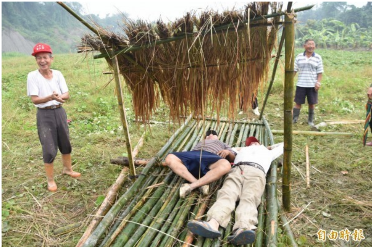
竹筏上搭建簡陋茅草屋遮風避雨。