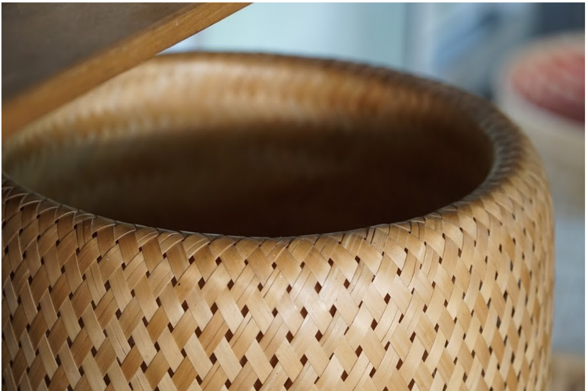
竹編桶運用雙層桶面創造厚實感，桶緣的技藝令人讚嘆。