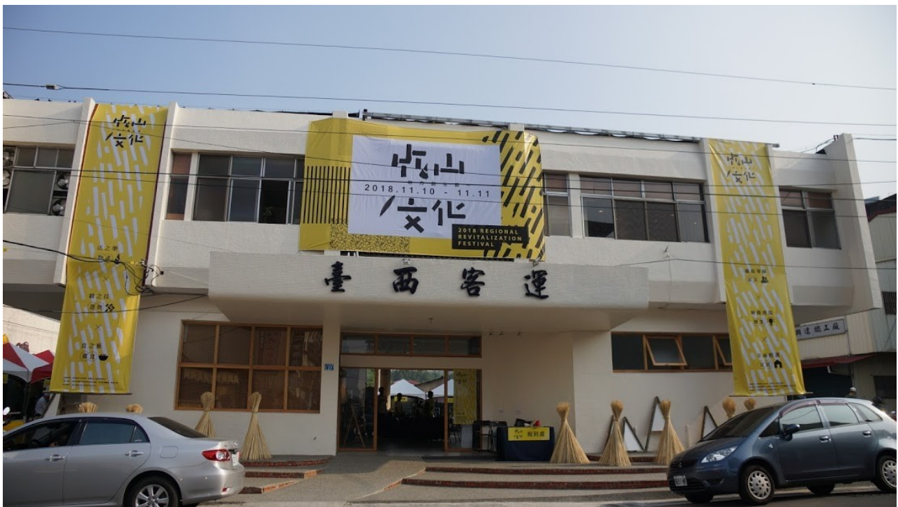
竹山文化節時，台西客運竹山站的外觀意象。

2018年的秋季仍像仲夏一樣艷陽高照，一群年輕人，不，應該說是一群在竹山鎮平日少見的青壯年齡族群，期望能有更多的青年返鄉，來改變這個大家出生成長的故鄉，用自己故鄉的風土人文，改變逐漸沒落的產業-竹材產業，盼能召喚出更多人的記憶和返鄉熱情；從他們身上可以看見無私追求共好的熱情，那是一道耀眼的光芒。