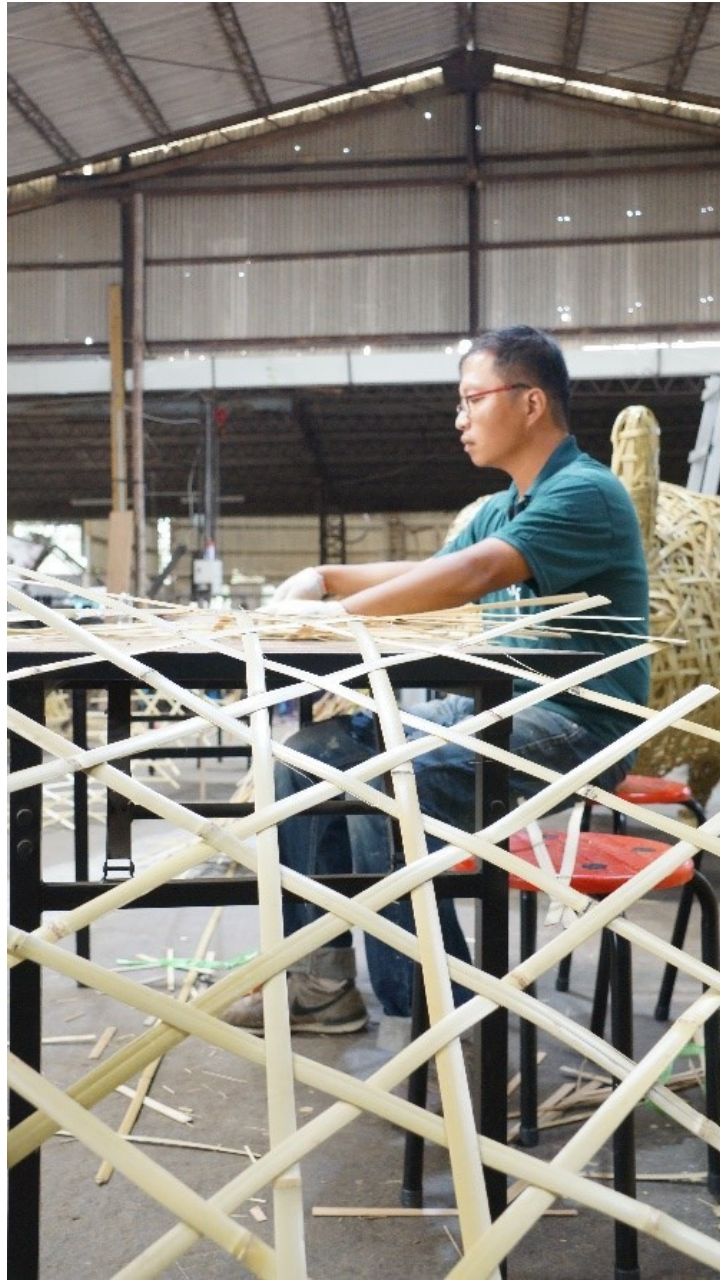
團隊夥伴製作每一構物體的基礎-竹編材。