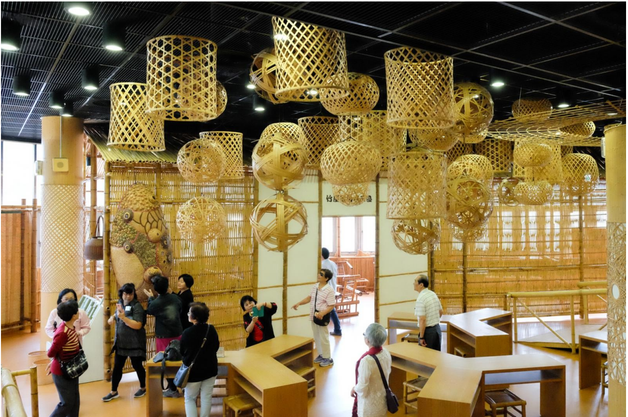
竹山擁有深厚的竹文化，擁有成為國內外竹藝交流基地的潛力

(本文與行政院農委會林務局「國產竹材產銷供應鏈建構與技術推廣計畫」合作刊登、計畫執行單位：工業技術研究院)