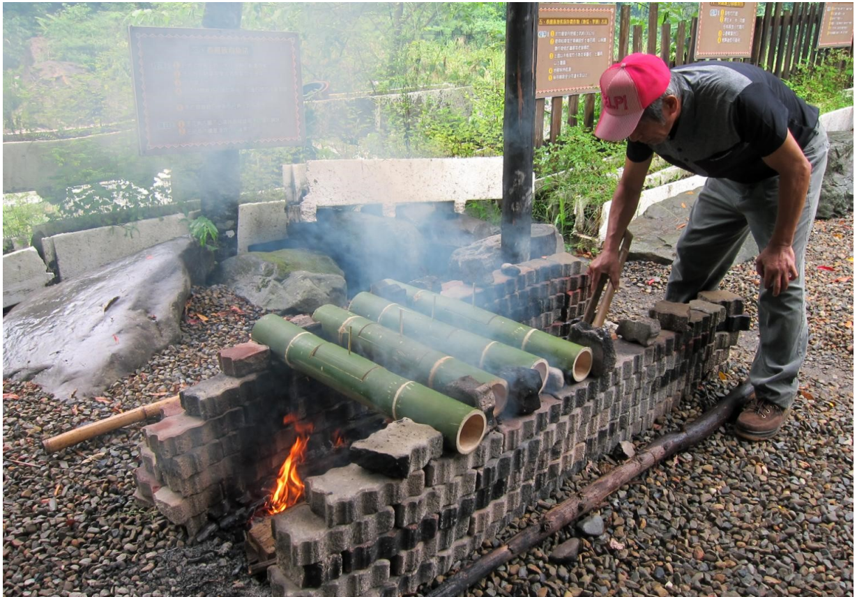
麻竹比起桂竹較為粗大，適合拿來裝湯，今天煮的南瓜湯正在柴火上滾著。