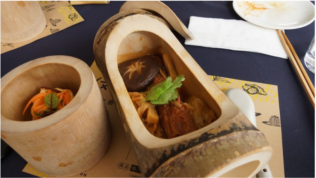
新生筍乾控肉，肋排搭配筍乾依舊美味，更有新感受。